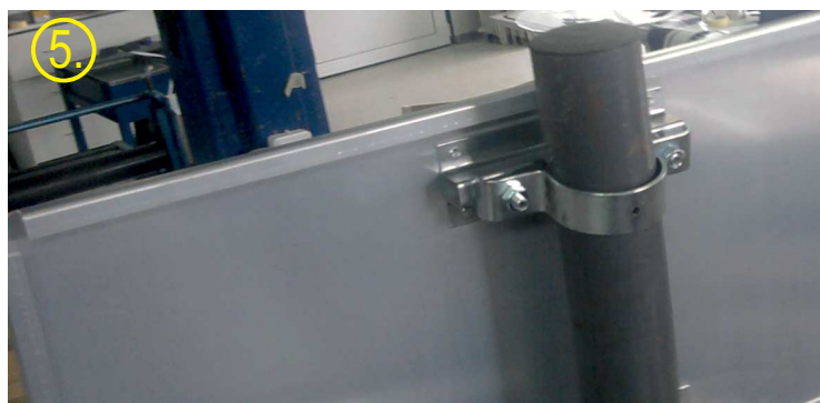
5. - postavljen znak na stub