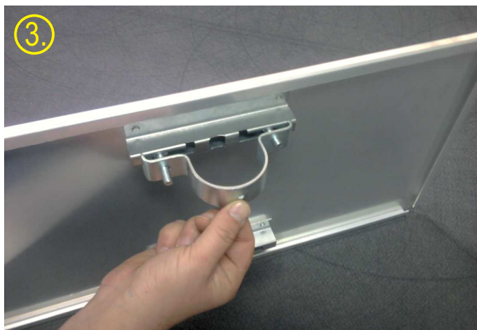
3. - postavljanje drugog dela šelne