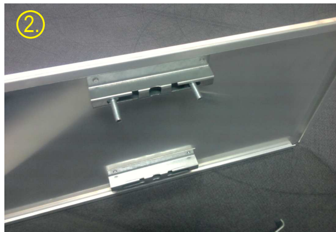
1. i 2. - umetanje vijaka u šelnu fiksiranu na znak